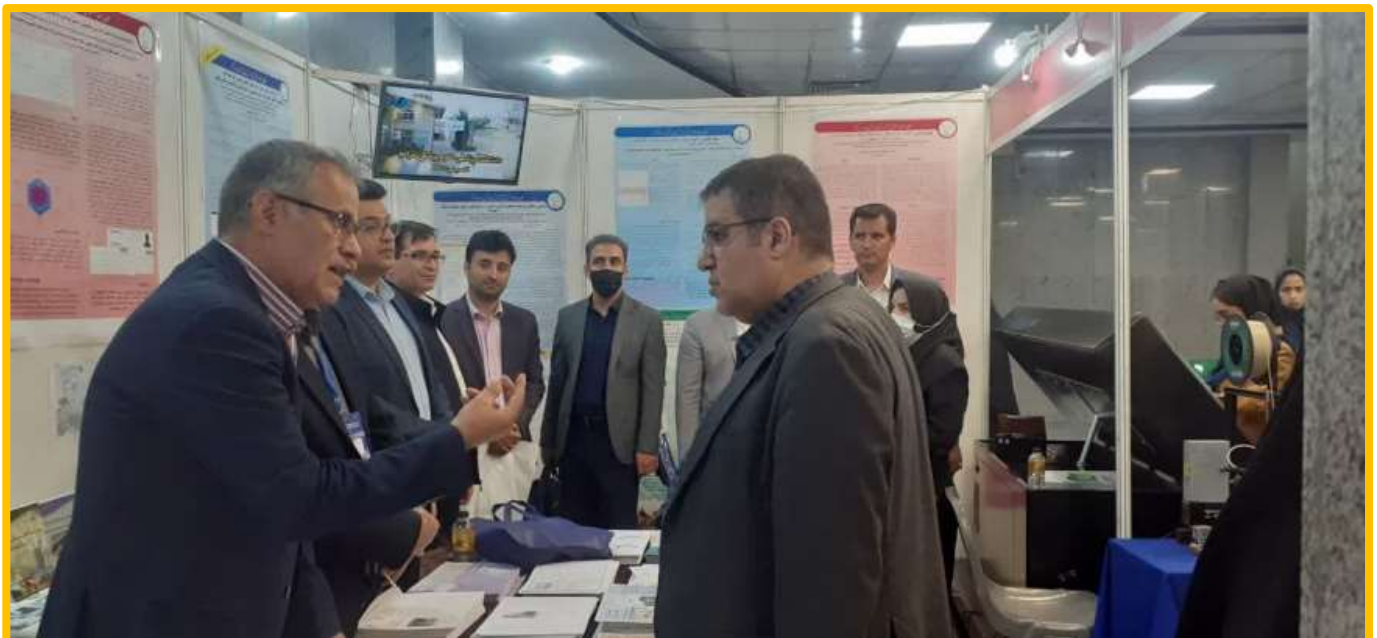
تصاویری از حضور معاون و مدیران حوزه آموزش، اعضای هیات علمی، کارکنان و دانشجویان دانشگاه در بیست و چهارمین همایش کشوری آموزش پزشکی