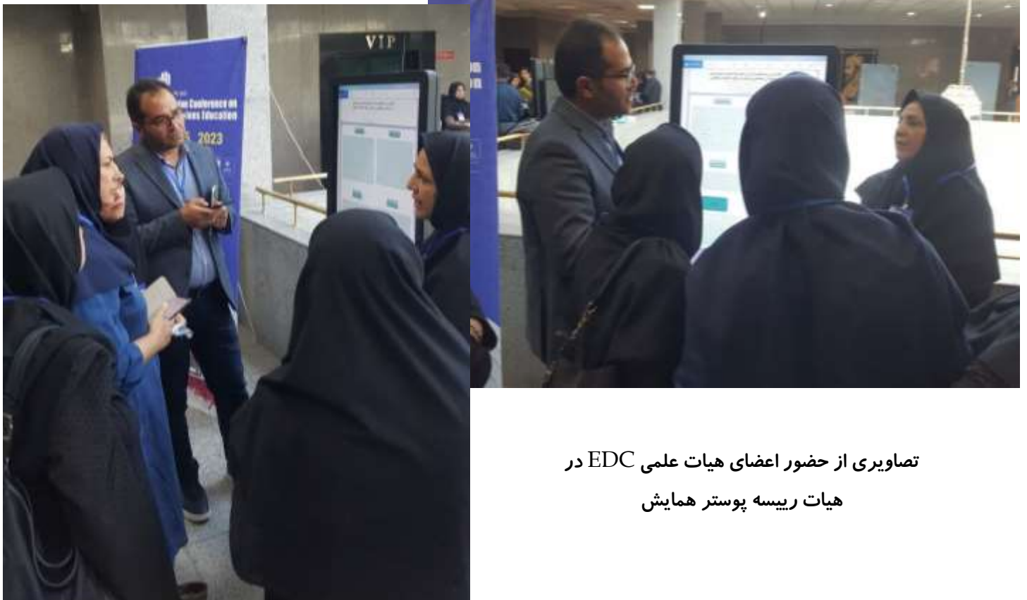
تصاویری از حضور اعضای هیات علمی EDC در هیات ریسه پوستر همایش