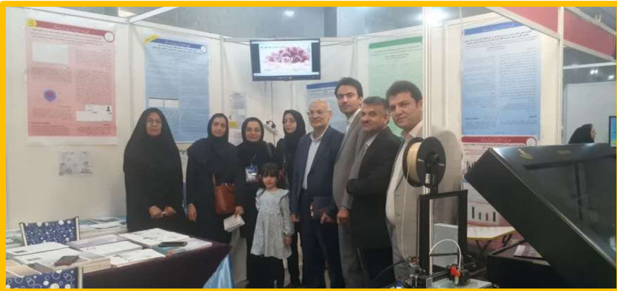
تصاویری از حضور اعضای هیات علمی و کارکنان دانشگاه در بیست و چهارمین همایش کشوری آموزش پزشکی