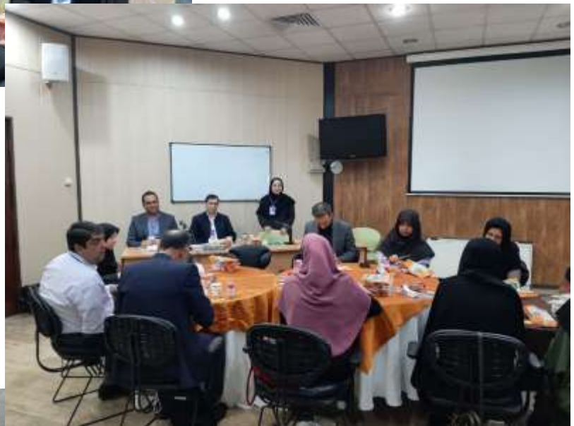
تصاویری از صبحانه کاری دانشگاه علوم پزشکی اردبیل در همایش آموزش پزشکی