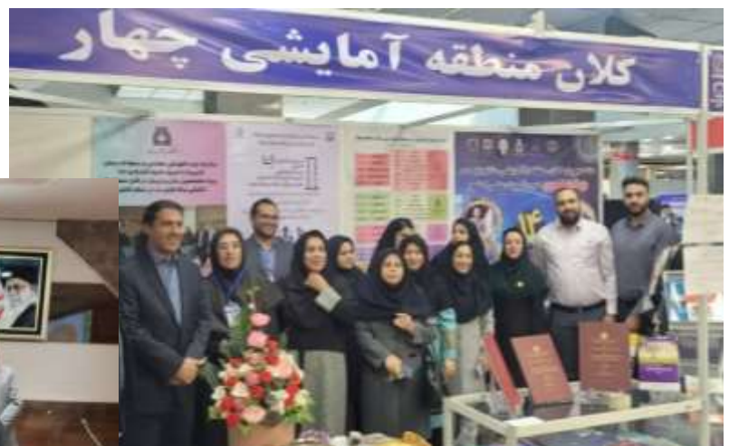
عکس یادگاری ارزشیابی غرفه کلان منطقه ۴ و کارگاه شماره ۱۴