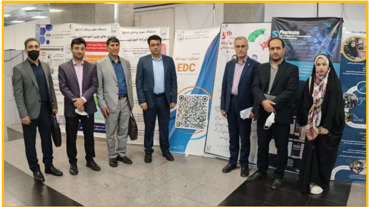
تصاویری از حضور ریاست دانشگاه، معاون و مدیران حوزه آموزش، اعضای هیات علمی، کارکنان و دانشجویان دانشگاه در بیست و چهارمین همایش کشوری آموزش پزشکی