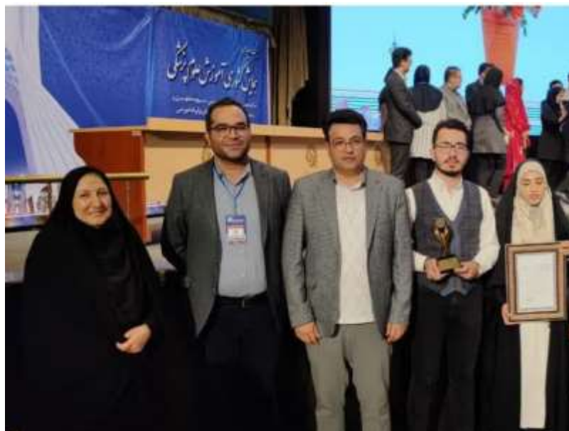
تصاویری از ارائه و دریافت جایزه مقام دوم ایده‌های دانشجویی نوآورانه آموزشی توسط دانشجویان دانشگاه